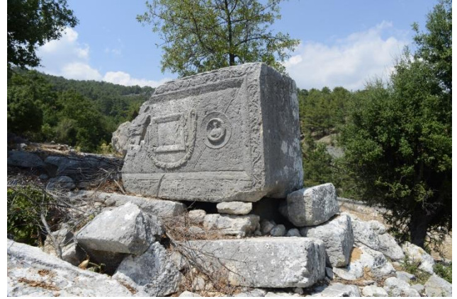
Fig. 5 Uzuntaş mevkiinde bulunan lahit mezarın genel görünümü

Uzuntaş mevkiinde bulunan lahit mezar tekne, kapak ve podyum olmak üzere üç parçadan oluşmaktadır. Tekne podyum üzerinde in-situ konumundadır ancak 1/3 oranında kırık bu nedenle ön yüzün sol tarafı hakkında bilgi alınamamaktadır. Kapak tekne üzerinden kay(dırıl)mış teknenin 2 m uzağında yerde ters durur vaziyettedir, büyük oranda korunmuş görünen kapak kırma çatı formunda ve köşe akroterlidir. Ön uzun yüzde podyumun bir basamağı görülebiliyorken doğuya bakan bir dar yüzde üç basamak görülebilmektedir.