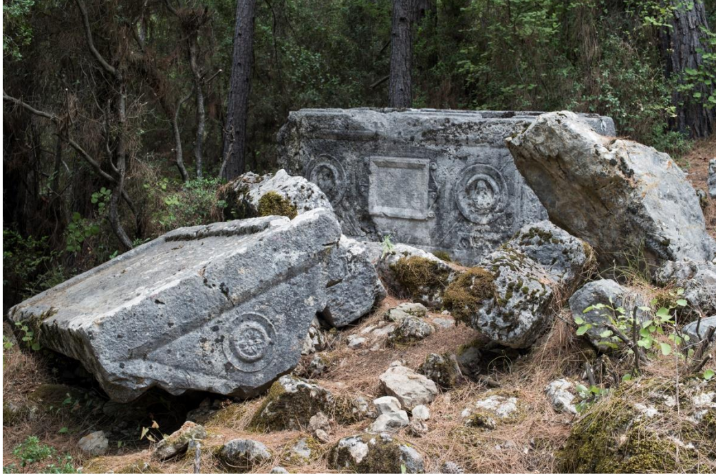
Fig. 1 Beşiktaş mevkiindeki Lahit mezar genel görünüm

Beşiktaş mevkiinde bulunan lahit mezar; tekne, yerinden kay(dırıl)mış kapak ve podyum olmak üzere üç parçadan oluşmaktadır. Tekne podyum üzerinde, kapak ise teknenin önünde yerde ters durur vaziyettedir. Podyum bloklarının bir kısmı tekne ile kapak arasında dağınık olarak bulunmaktadır. Kireçtaşı malzemeden üretildiği için taşın yüzey dokusunda bozulmalar meydana gelmiş yer yer küçük kırıklar ve çatlaklar oluşmuş ancak genel görüntü itibariyle tüme yakın oranda korunmuştur. Tekne 2.30 m boy, 1.13 m en ve 1.27 m'yükseklik ölçülerinde in-situ konumunda ve doğu-batı doğrultuludur. Lahit kapağı 2.45 m boy, 1.25 m en ve 0.73 m yükseklik ölçülerinde, kırma çatı formundadır. Tekne ve kapak kireçtaşı