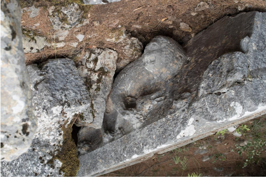
Fig. 2 Beşiktaş mevkiindeki Lahit kapağı ve üzerindeki aslan kabartması

malzemeden üretildiği için yüzey dokusunda bozulmalar meydana gelmiş yer yer küçük kırıklar ve çatlaklar oluşmuştur ancak genel görüntü itibariyle tüme yakın korunmuşlardır. Teknenin bir uzun yüzü ve iki dar yüzü bezenmiş, arka yüz işlenmeden kabaca tıraşlanarak bırakılmıştır. Lahit kapağının bir uzun yüzü üzerinde, gövdesi profilden yüzü ise cepheden verilmiş ayakta duran bir aslanın sağ kolu ile boğayı yakaladığı sahne kabartma olarak işlenmiştir. Kapaktaki bir diğer bezeme örgesi de yüzeyden görülebilen akroterlerden birinde yer alan palmet bezeğidir. Üç yapraktan oluşan açık palmet bezeğinin yaprakları köşe akroterini kaplayacak şekilde yerleştirilmiştir.