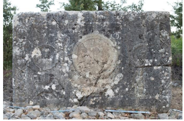
Fig. 4 Kırtepe mevkiindeki lahit teknesinin ön yüzüne uygulanan RTI metodu ile elde edilen görünüm. A. Akçay