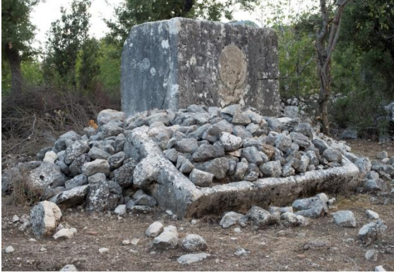
Fig. 3 Kırtepe mevkiinde bulunan lahit mezar genel görünüm

yüzde sahnenin etrafı yanlardan ve üstten bir friz kuşağı ile çevrilidir. Yanlarda birer volütlü krater içinden çıkarak yükselen üzüm salkımı ve asma dalı taşıyan sarmal motif görülür.